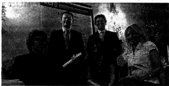
Junior Chamber I premiati con i responsabili dell'associazione.

Cultura, business e volontariato i settori dove operano i premiati