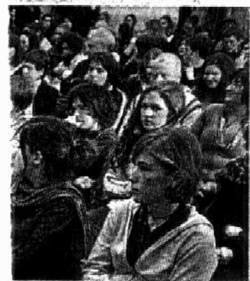
Qui sopra, la platea degli studenti.